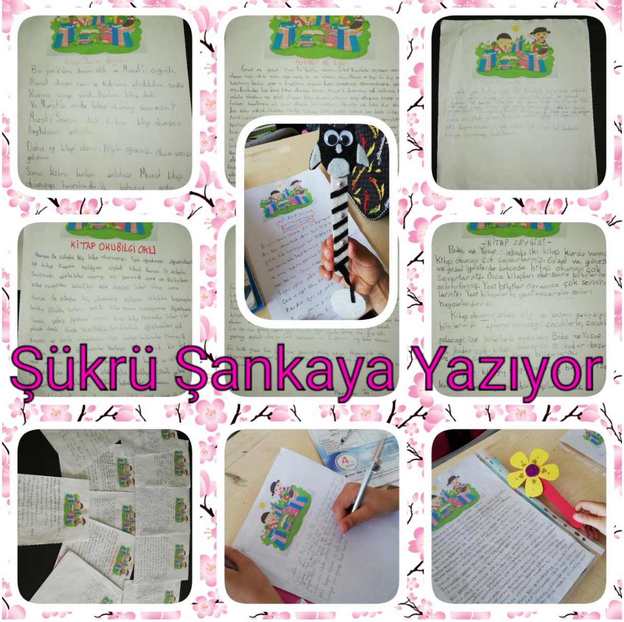
Sergimize velilerimiz de katıldı